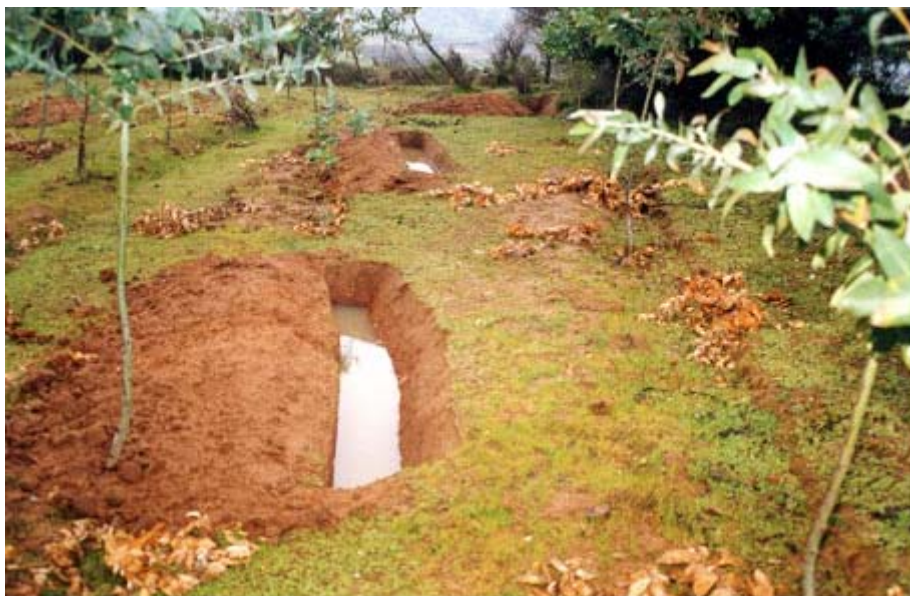
Foto 3: La frecuencia con que las zanjias de infiltración aparecen llenas de agua tras las lluvias resultan muy reveladoras de la escorrentía existente en un predio y de la conveniencia de realizar medidas de conservación de aguas y suelos en él. (Sierras de Bellavista, Precordillera de San Fernando, Región de O'Higgins. Foto Mauricio Lemus)

técnicas eficientes en la lucha contra la desertificación, aun no incorporadas en el marco legal, será una efectiva herramienta contra la desertificación.