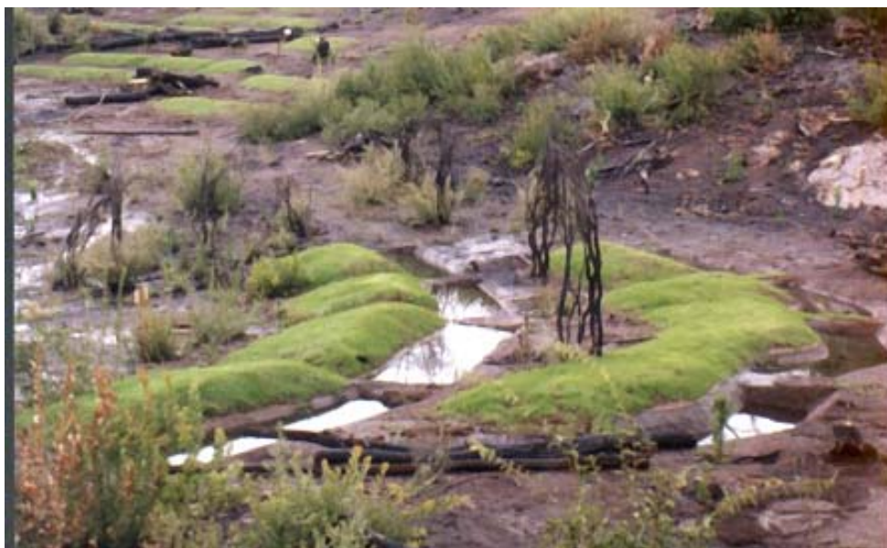
Foto 2: Con zanjas de infiltración bien diseñadas y distribuidas se consigue reducir el escurrimiento y la erosión, infiltrando el agua y reteniendo el suelo y los nutrientes en los lugares deseados. (Pumanque Secano interior, Región de O'Higgins.)

Debemos recuperar las técnicas tradicionales de aprovechamiento agroforestal del territorio y potenciar aquellas actualmente bonificadas por concepto de conservación de suelo: aplicando –eso sí– los nuevos conocimientos adquiridos: utilización de modelos hidrológicos sobre conservación de suelos y aguas, manejo de sistemas de información geográfica, introducción de especies vegetales con interés ecológico, económico y social, uso e incorporación de nuevos materiales.