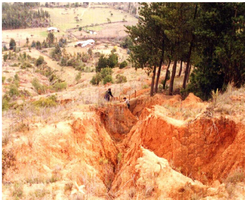
Foto 1: La formación y el avance de cárcavas denota un claro proceso de desertificación (Pumanque Secano interior, Región de O'Higgins. Foto: Guillermo Navarro)

La desertificación suele definirse como un proceso complejo que reduce la productividad y el valor de los recursos naturales, en el contexto específico de condiciones climáticas áridas, semiáridas y subhúmedas secas, como resultado de variaciones climáticas y actuaciones humanas adversas (UNCCD, 1994). Éste es un grave problema que afecta a Chile. En la actualidad, se estima que afecta al 62% del territorio nacional, lo que corresponde a 47,3 millones de hectáreas (según datos del Programa de Acción Nacional contra la Desertificación PANCD, 1997). La gravedad de este problema radica en efectos múltiples tales como “el deterioro del balance hídrico, el desplazamiento de la cobertura vegetal, su pérdida de productividad y de capacidad colonizadora, el predominio de la escorrentía superficial, el incremento de la erosión hídrica y eólica, así como la sedimentación local, la salinización de los suelos y la pérdida de población y de sus valores socioculturales por incapacidad del territorio para sostener a la población preexistente” (TRAGSA, 2003).